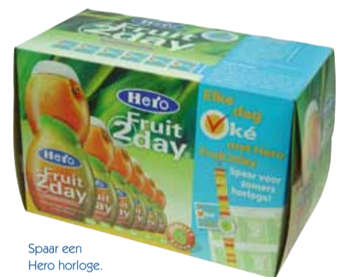
Spaar een Hero horloge.

gratis premium, op het product Rabo Mobiel van de Rabobank. Een spaaractie voor een leuk trendy horloge was voor Hero de manier om haar product Fruit2Day onder de aandacht te brengen. Door het uitknippen van de Fruit2Day zegels op de verpakking kon men een horloge sparen. Benieuwd wat we voor u kunnen doen? Bel ons gerust eens op met een vraag en we gaan direct voor u aan de slag!