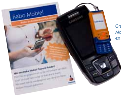
Gratis Rabo Mobiel Flasher en prijsvraag.

Alles wat thematisch is, ligt voor jaren vast. Daar gaat het immers om bij het opbouwen van naamsbekendheid en imago, en daar is tijd voor nodig. Keyword van actiemarketing is juist flexibiliteit. Met actiemarketing kan een bedrijf zich niet alleen onderscheiden, maar ook op korte termijn resultaat behalen op gebieden als loyalty en sales. Want actiemarketing is gericht op het beïnvloeden van gewenst gedrag. 'Actiemarketing stelt organisaties in staat klanten te binden en nieuwe te acquireren. Organisaties zoeken naar manieren om zich te onderscheiden en vinden die in actiecampaagnes,' aldus twee conclusies uit een onderzoek van de Rijksuniversiteit Groningen (2007).